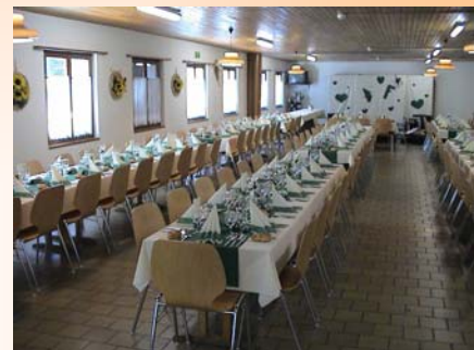
Speisesaal mit Bestuhlung